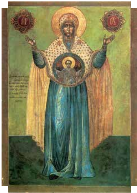
Icona della Madre di Dio di Mirozh

Come possiamo custodire e nutrire la parola di Dio accolta nella nostra anima? Il verbo greco tradotto poco fa come "custodire" (fulasso), significa anche "osservare", nel senso in cui si "osserva", cioè si mette in pratica, un regolamento o una legge. "Nutrire" la parola di Dio seminata nel nostro cuore significa dunque metterla in pratica. L'apostolo