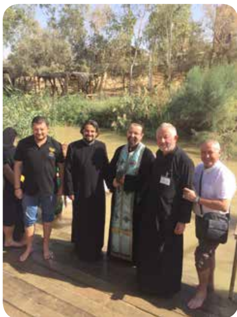
Al fiume Giordano

l'essersi fatto uomo, moriremo di stupore per la tenerezza del cuore di Dio, la cui capacità di amare è così grande da farsi un bambino... E tuttavia la maggioranza della gente non si accorge nemmeno che quel bambino è nato". È successo così duemila anni fa: in quanti si sono accorti che Gesù era nato? E oggi, quanti comprendono che non si vive veramente il Natale se non ci si commuove davanti a questo amore di Dio, se non ci si stupisce del modo incredibile che Dio ha di amare l'umanità? Interrogiamoci, per cominciare, noi cristiani battezzati. Che cosa rappresenta il bimbo nato a Betlemme per me, creatura smarrita che deve affrontare l'arcano inquietante di un pellegrinaggio terreno senza certezze, verso un destino che non mi è noto?